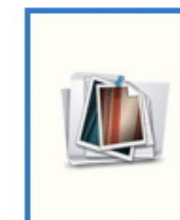
อ.พญ. เมธินี โพธิ์วราพรคน อีเมลล์